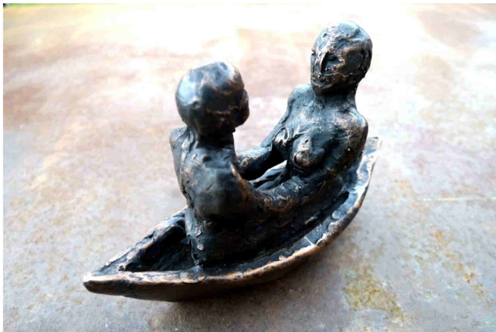
Coppia in barca 2019, Bronze Vollguss L: 120mm, H: 80mm, 780g

Die Wachsmodelle wurden im Wachs ausschmelzverfahren (cera persa) in Bronze gegossen und sind Unikate.