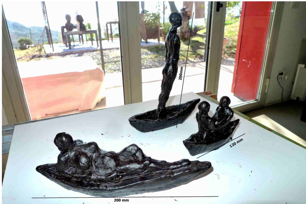
3 Wachsmodelle: Rusalka, Ulisse, Coppia in barca

Da der Bronzeguss sehr aufwändig und auch in Italien, nicht ganz billig ist, habe ich mit ganz kleinen Schiffsskulpturen begonnen.