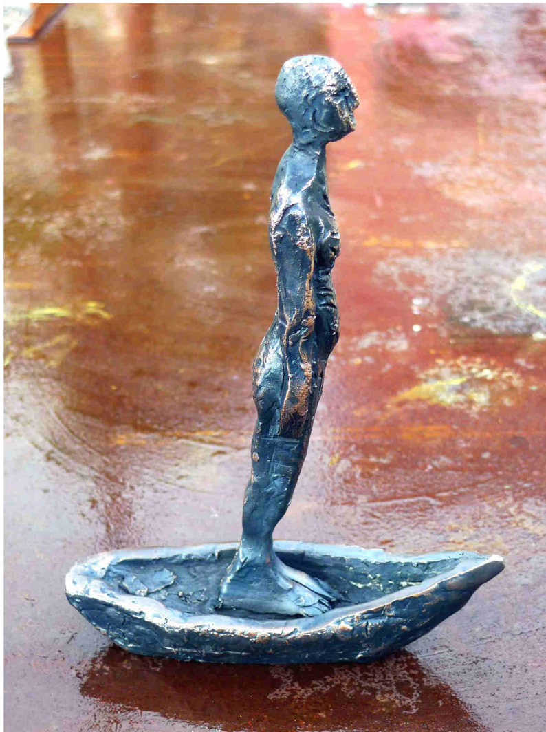
Ulisse 2019, Bronze Vollguss L: 150mm, H: 200mm, G: 1120g