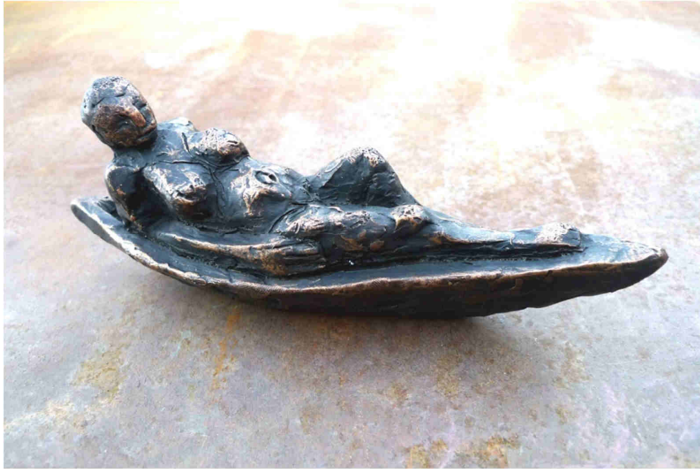
Rusalka 2019, Bronze Vollguss L: 200mm, H: 75mm, G: 1600g